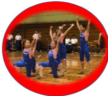
ナゴヤゴールドントワラズ