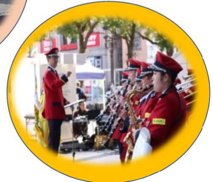
ポッカレモン消防音楽隊